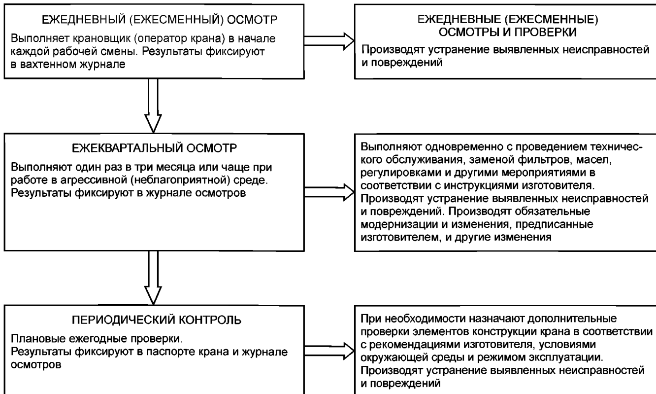
Рисунок Б.1 — Проведение технического контроля при наличии инструкций изготовителя