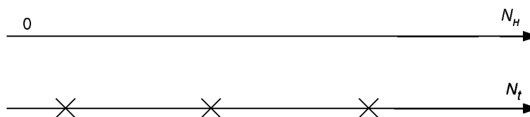
Рисунок Д.1 — Определение условий, при которых выполняют операции технического контроля и обслуживания кранов

На рисунке Д. 1 показаны два отрезка прямых, из которых верхний соответствует нормативному характеристическому числу, а нижний — текущему характеристическому числу. Крестиками обозначены условия, при которых выполняют операции технического контроля и обслуживания крана.